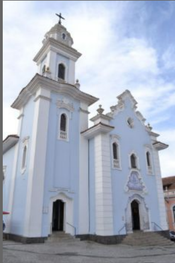
Igreja do Rosário, 2016.