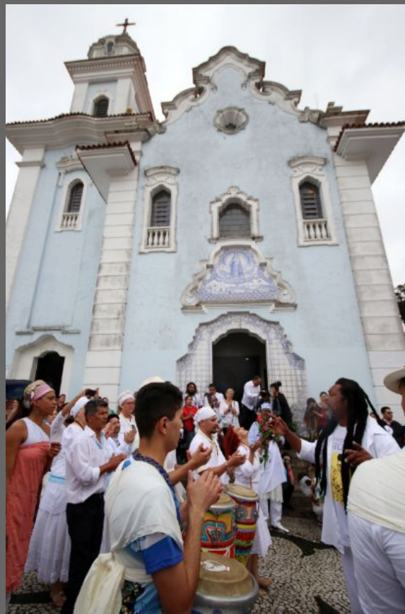
Igreja do Rosário, 2018.