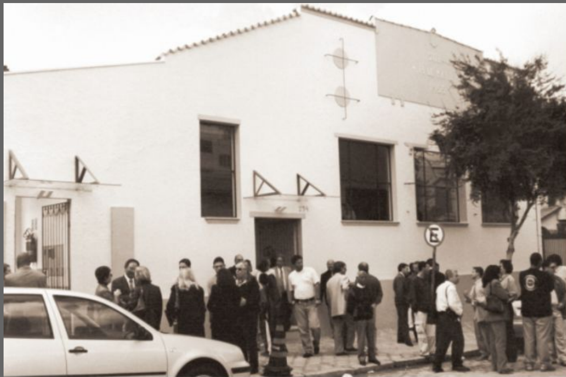
Clube Treze de Maio.