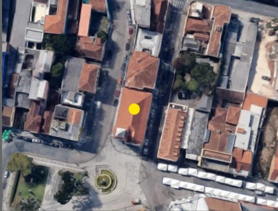
Igreja do Rosário.