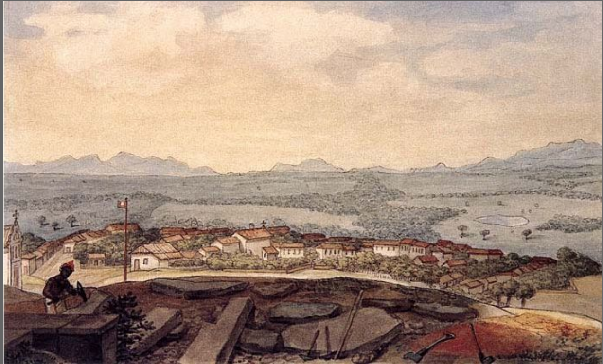
Debret, Jean-Baptiste. Curitiba. 1827.