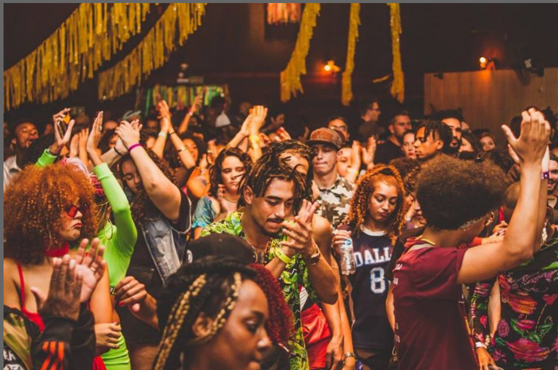
Clube Treze de Maio.