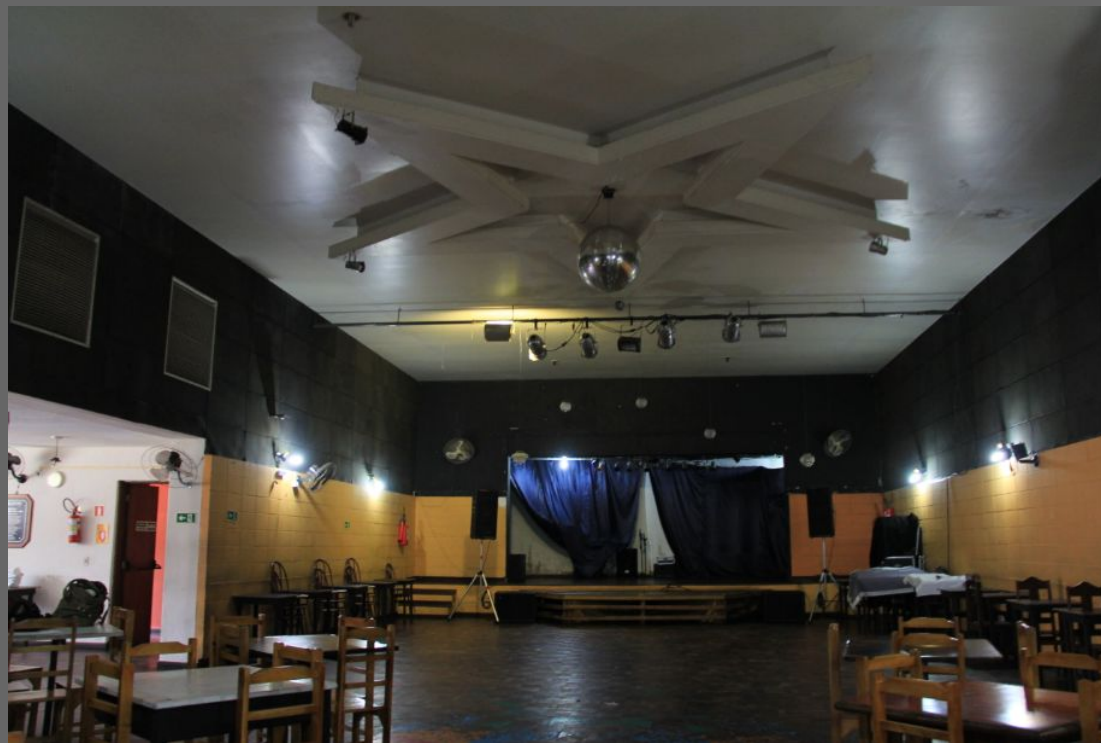
Clube Treze de Maio.