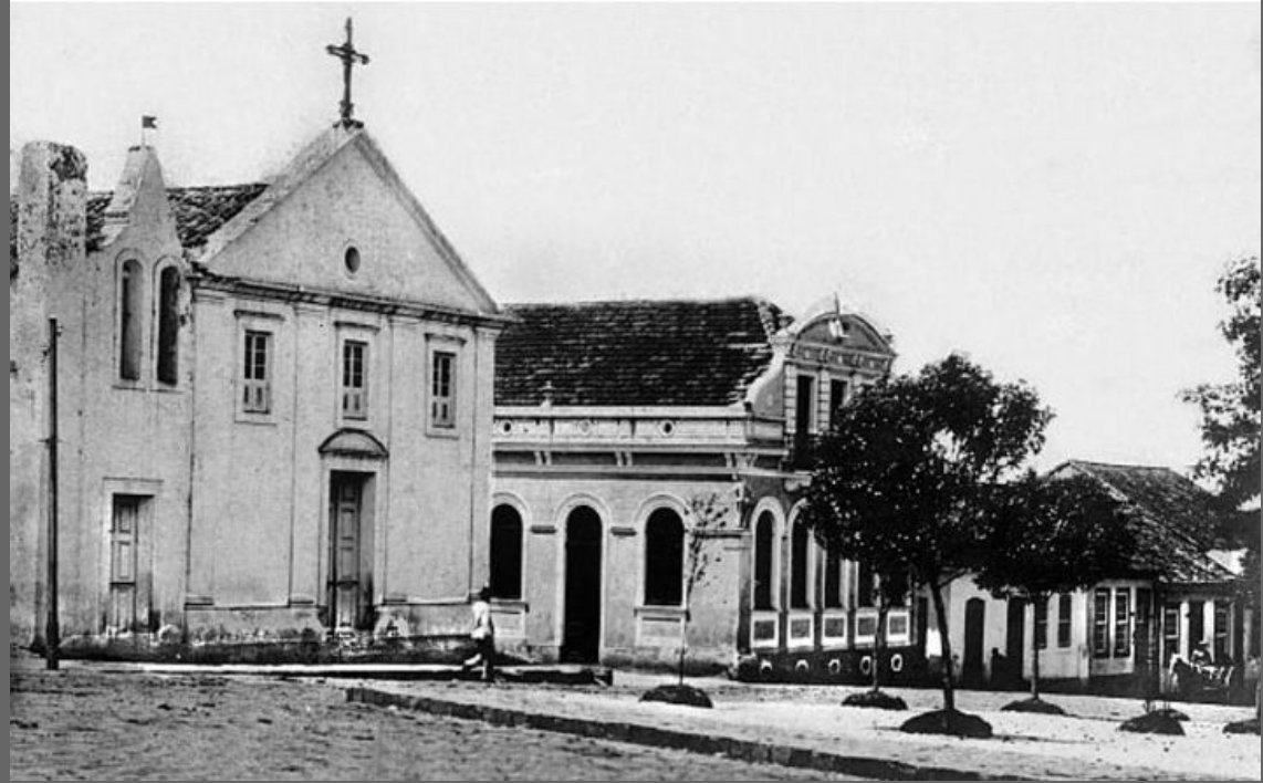
Igreja do Rosário, 1900.